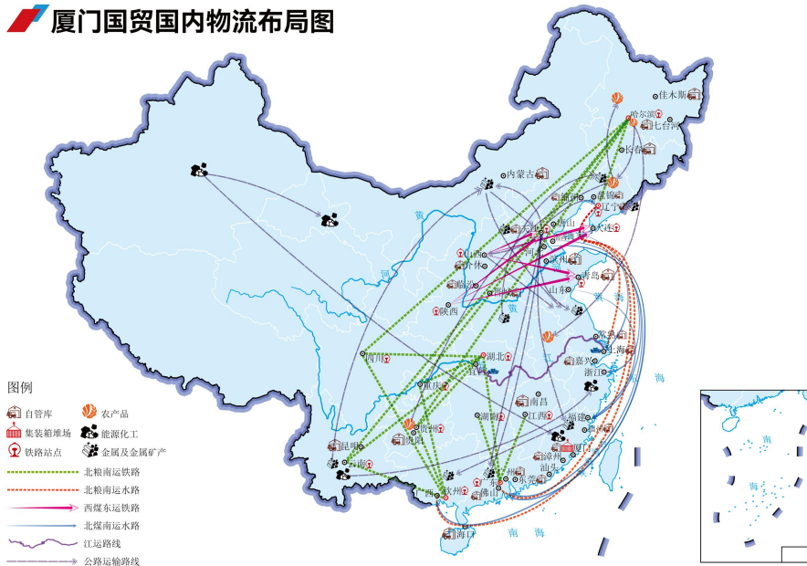
厦门国贸国内物流布局图

外协船江运年运输量超千万吨。公司在印尼、新加坡、几内亚等地投资布局关键物流核心资产，自有 30 万吨级超大型浮仓 1 艘，经营管理拖轮 15 艘、驳船 18 艘，持续加强国际物流服务能力。